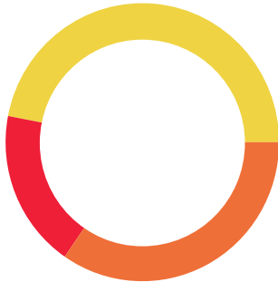
ENLACE GLOBAL PM C/INTERESES (Saldo inicial de $15,878.75)